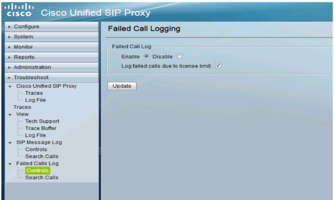
启用失败的呼叫记录