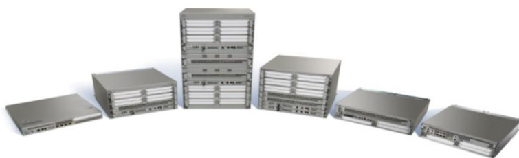
图 1. Cisco ASR 1000 系列聚合服务路由器

与前几代的思科中端路由解决方案相比，Cisco ASR 1000 系列将服务运行性能提高了 10 倍以上，从而显著提升了价值 此外，该系列路由器具有硬件和软件冗余功能，并采用行业领先的低中断设计。