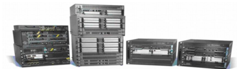
图 2. Cisco 中端路由产品系列

思科软件激活支持从 2.5 Gbps 到 5 Gbps（Cisco ASR 1001 路由器）和 5 Gbps 到 10、20 或 36 Gbps（Cisco ASR 1002-X 路由器）的性能升级。从性价比角度看，Cisco ASR 1000 系列路由器解决方案非常适合在 Cisco 7200 系列、Cisco 7300 系列、Cisco 7600 系列、Cisco ASR 9000 系列以及 Cisco Catalyst® 6000 系列路由器之间使用，从而显著增强思科中端路由产品组合的性能（图 2）。