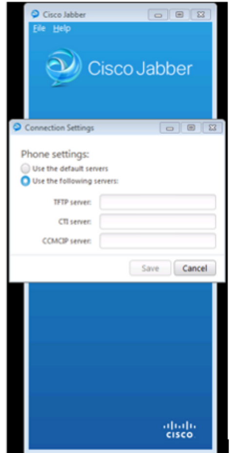
Phone Mode Only

왼쪽 이미지에서 Jabber는 완전한 UC(Unified Communications) IM and Presence 모드에 있습니다. 서버 유형을 선택하고 서버의 로그인 정보를 입력할 수 있습니다.