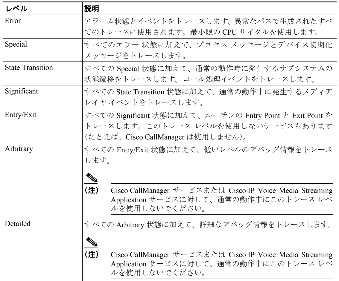
表 5-2 サービスのデバッグ トレース レベル

表 5-3 に、servlet のデバッグ トレース レベルの設定値を示します。