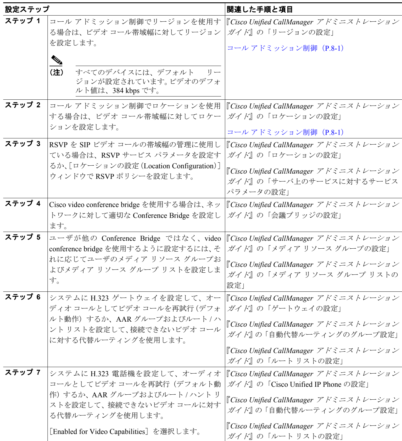
表 44-1 ビデオ テレフォニー設定チェックリスト

表 44-1 に、Cisco Unified CallManager の管理ページでビデオ テレフォニーを設定するためのチェックリストを示します。