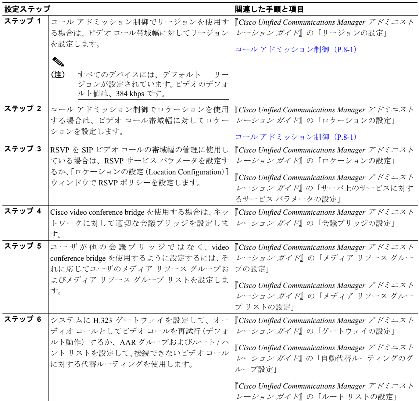
表 45-1 ビデオ テレフォニー設定チェックリスト

表 45-1 に、Cisco Unified Communications Manager の管理ページでビデオ テレフォニーを設定するためのチェックリストを示します。