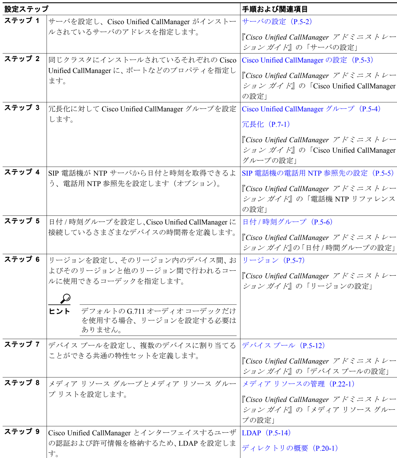
表 5-2 システム設定チェックリスト

表 5-2 は、システム レベルの設定値を設定するための一般的な手順を示しています。