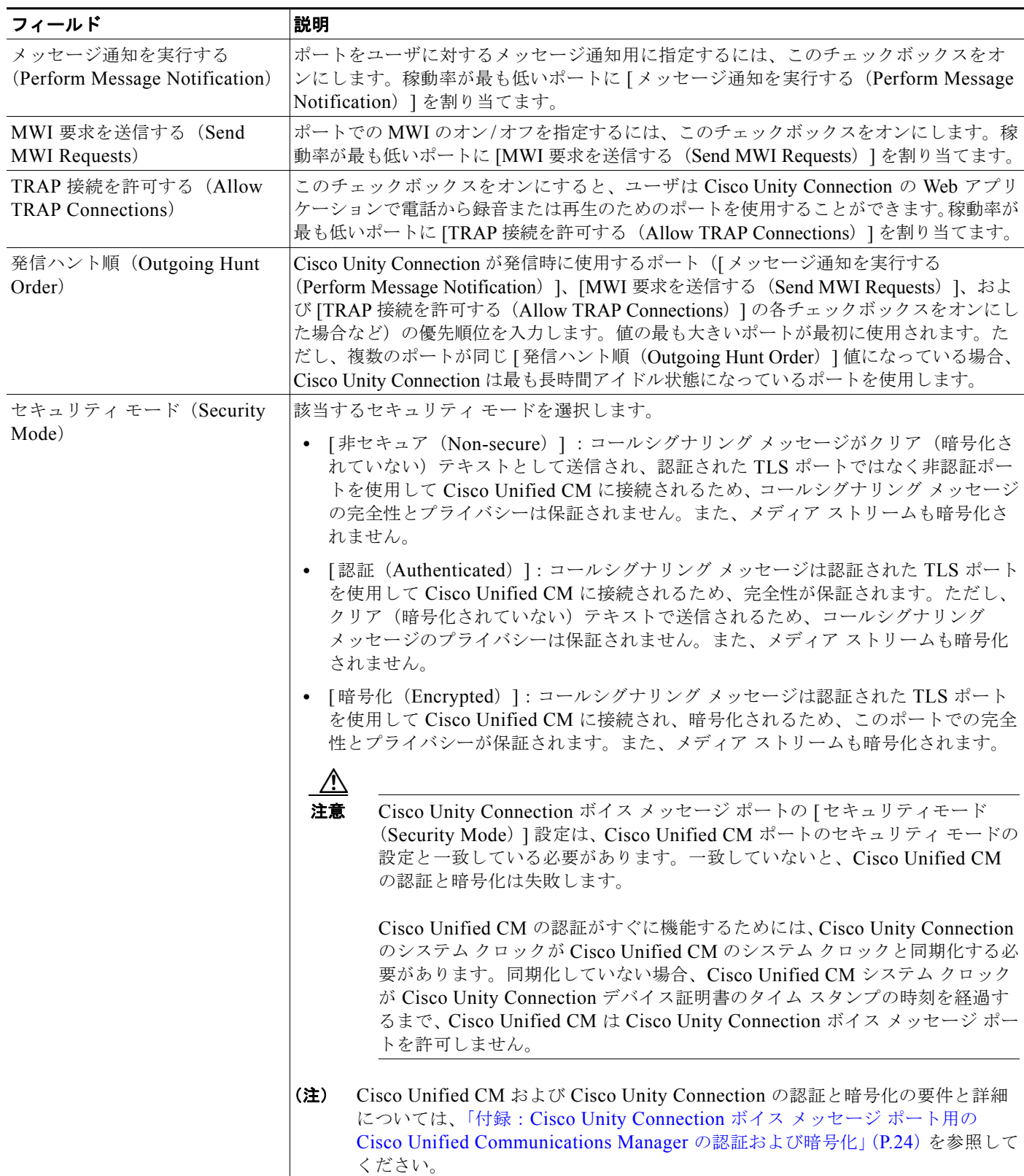
表 14 ボイス メッセージ ポートの設定 (続き)