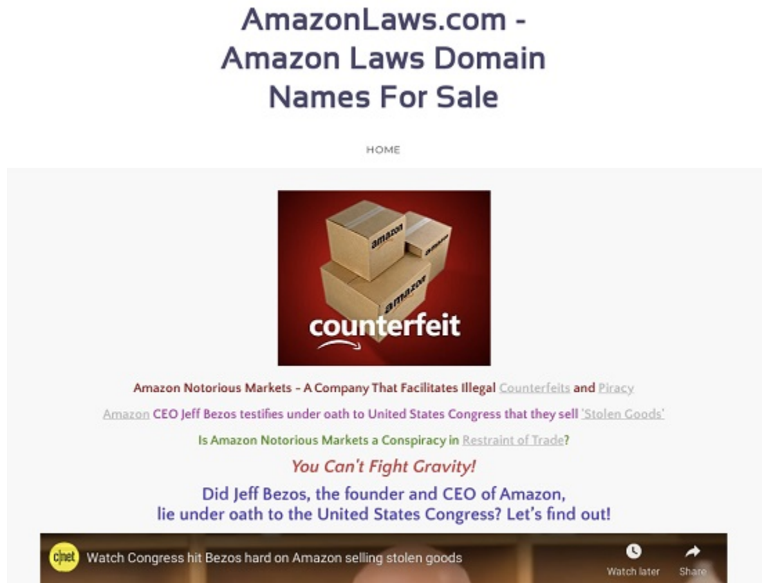
図 2: 例 : Amazon AWS にアクセスしようとするユーザをターゲットとする広告ページ

新しい分類子は、最も一般的なドメインをターゲットとするタイポスクワッティングドメインからユーザを保護することを目的としています。分類子は、ドメインの類似性を計算することで、最も一般的なドメインに類似するドメインを効率的に識別します。その後、タイポスクワッティングドメインの運用期間などの追加パラメータに基づいて脅威の重大度を決定します。