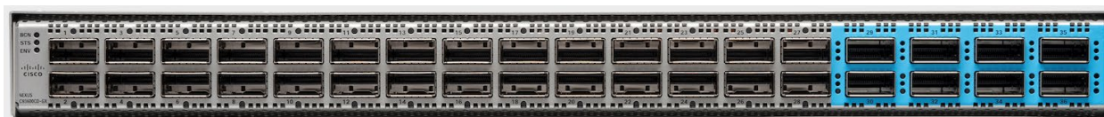
図 2. Cisco Nexus 93600CD スイッチ

Cisco Nexus 93600CD-GX スイッチ (図 2) は 1RU のスイッチで、28 個の固定 40/100G QSFP-28 ポートと 8 個の固定 10/25/40/50/100/200/400G QSFP-DD ポートのすべてにおいて 12 Tbps の帯域幅と 4.0 bpps のスループットをサポートしています。28 個のポートでは 10/25 Gbps をサポートしています。詳細については、下の機能の表を参照してください。