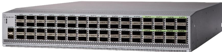
図 2. Cisco Nexus 9364C スイッチ

Cisco Nexus 9364C ACI スパイン スイッチは、Cisco ACI 対応の 2 ラックユニット (2RU) のスパイン スイッチで、64 個の固定 40/100G QSFP28 ポートと 2 個の固定 1/10G SFP+ポートのすべてにおいて、12.84 Tbps の帯域幅と 4.3 bpps の処理能力を実現しています (図 2)。ポート 1 ~ 64 では、ブレイクアウトはサポートされません。緑色でマーキングされた最後の 16 個のポートは、ワイヤーレート MACsec 暗号化 1 をサポートしています。