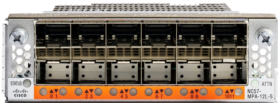
図 2. NC57-MPA-12L-S-FC モジュラポートアダプタ