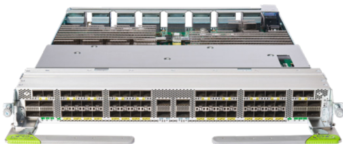
図 3. 88-LC1-52Y8H-EM、52x SFP28、8x QSFP28、4x QSFP56-DD MACSec 対応ラインカード

Cisco 88-LC1-52Y8H-EM は、P100 ベースの MACSec 対応ラインカードです。このラインカードは、52 ポートの SFP28、8 ポートの QSFP28、4 ポートの QSFP56-DD を提供し、帯域幅を 3.7 Tbps に集約します。