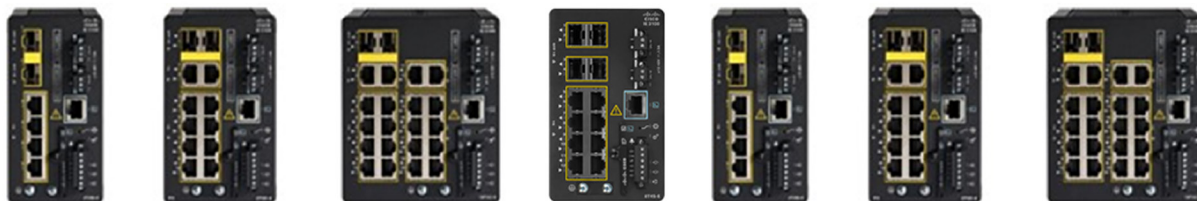
図 1. IE-3100 高耐久性シリーズ スイッチモデル