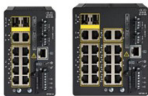
図 2. 強化された機能セットを備えた IE-3105 高耐久性シリーズ スイッチモデル