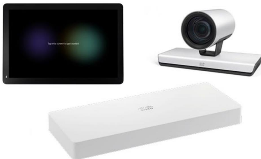
图 1. 用于大型会议室的思科 Webex Room Kit Plus P60 Integrator Package

尽管 Room Kit Plus P60 高清视频会议设备组合具备颇为丰富的功能性和用户体验，但在价格和设计方面却展现出很大的灵活性，能满足企业各种会议空间的需求 - 您可在企业内部完成注册，或通过思科®协作云将其注册到思科 Webex 平台。