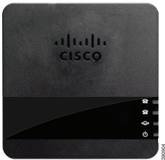
図 1-1 シスコ アナログ電話アダプタ