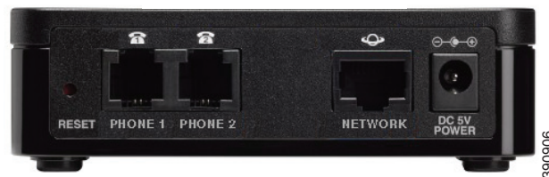
図 3-1 Cisco ATA 背面パネル

RESET : ペーパー クリップなどを使用してこのボタンを短く押し、ユニットを再起動します。出荷時のデフォルト設定に戻すには、10 秒間押し続けます。