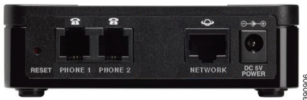
図 1-3 ATA 190 : 背面図

ATA 190 は小型で設置しやすいデバイスです。図 1-3 に、ATA 190 の背面パネルを示します。