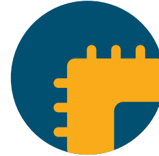
オール NVMe ストレージ アーキテクチャ