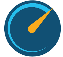
遅延の影響を受けやすいアプリケー ションのパフォーマンスを確保