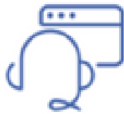
WebRTC Agent Desktop