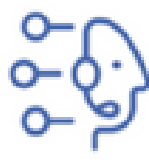
Virtual Agent Google DialogFlow CX